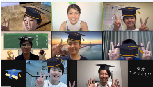
親子で学ぶ資産形成スタートクラス 2ヶ月コース 最終日 2021.8.8