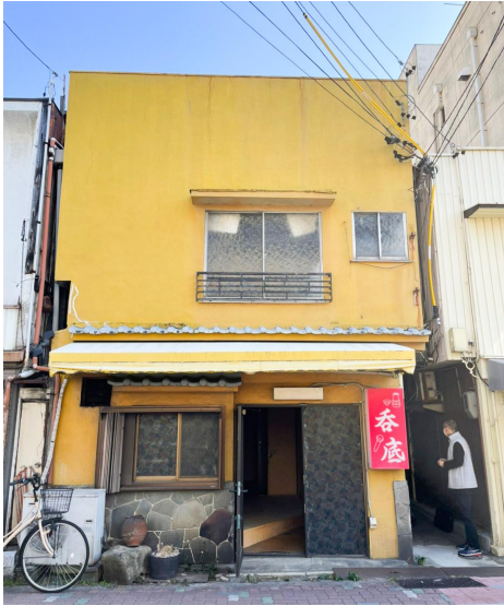
マッチングした物件(改装前)

今回、紅茶専門カフェオープンに向けて家主は「 自分も紅茶が好きなのでこれからが楽しみです 」と話しています。