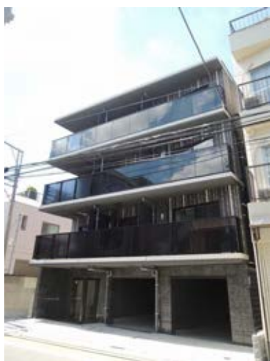
▲プレセダンヒルズ中板橋 外観