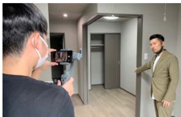
▲オンライン内見の様子