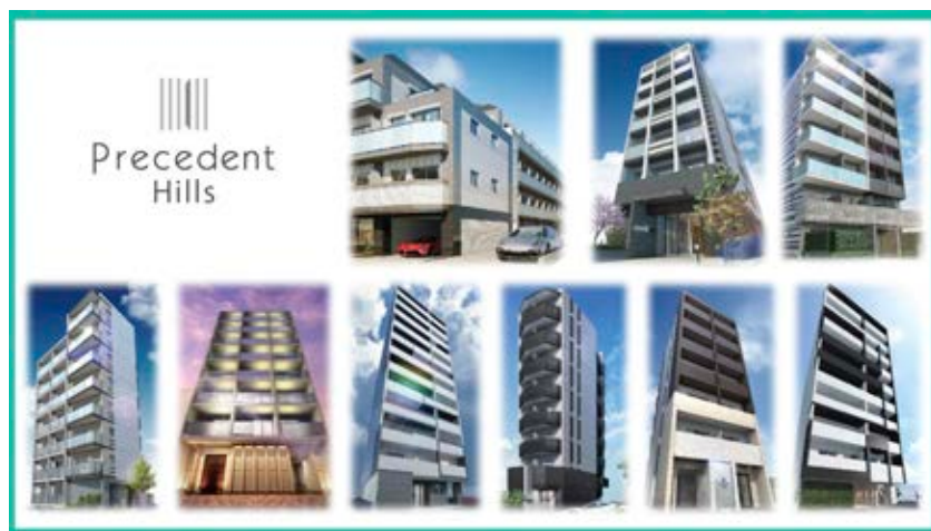
▲Precedent Hills（プレセダンヒルズ）シリーズ