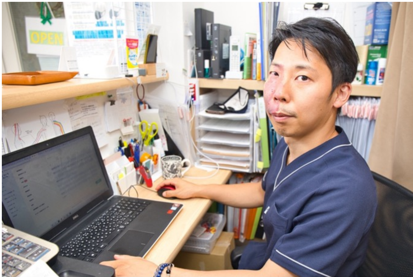
▲あし花整骨院 様 実際の活用シーン