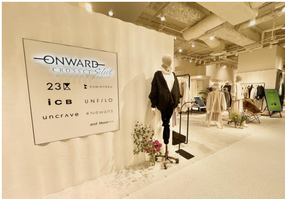
▲阪神梅田本店「ONWARD CROSSET SELECT」外観

OMO型店舗とは、2021年4月にスタートした実店舗とオンラインストアのメリットを融合した新業態で、ブランドの垣根を超えた売り場づくりと商品のみならずサービスも併設していることが特徴です。これまでに埼玉・愛知・千葉・高知の4店舗を展開していましたが、この秋の出店拡大により、全国13都府県、計14店舗にて展開します。今後、より多くのお客様に利用していただくことを目的に、さらなる出店拡大をまいります。