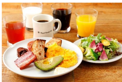
アメリカンプレート