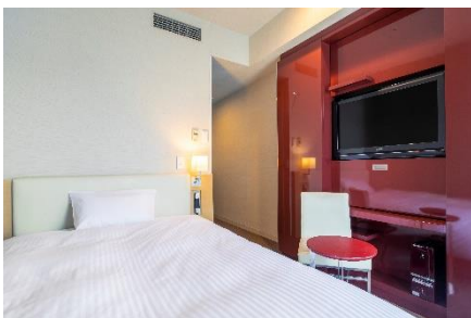
スタンダードシングル

客室はビジネス向きのスタンダードシングルから、複数名利用でも快適な広さのツインルームまで多彩なバリエーションがございます。