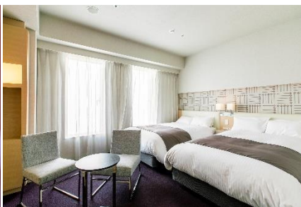
スタンダードツイン