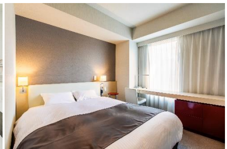
デラックスダブル