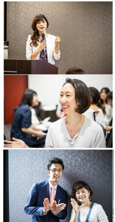
▲全国に広がる認定コンサルタント（2020年3月時点）