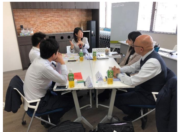
▲オンラインでの養成講座開催の様子（2020年8月）