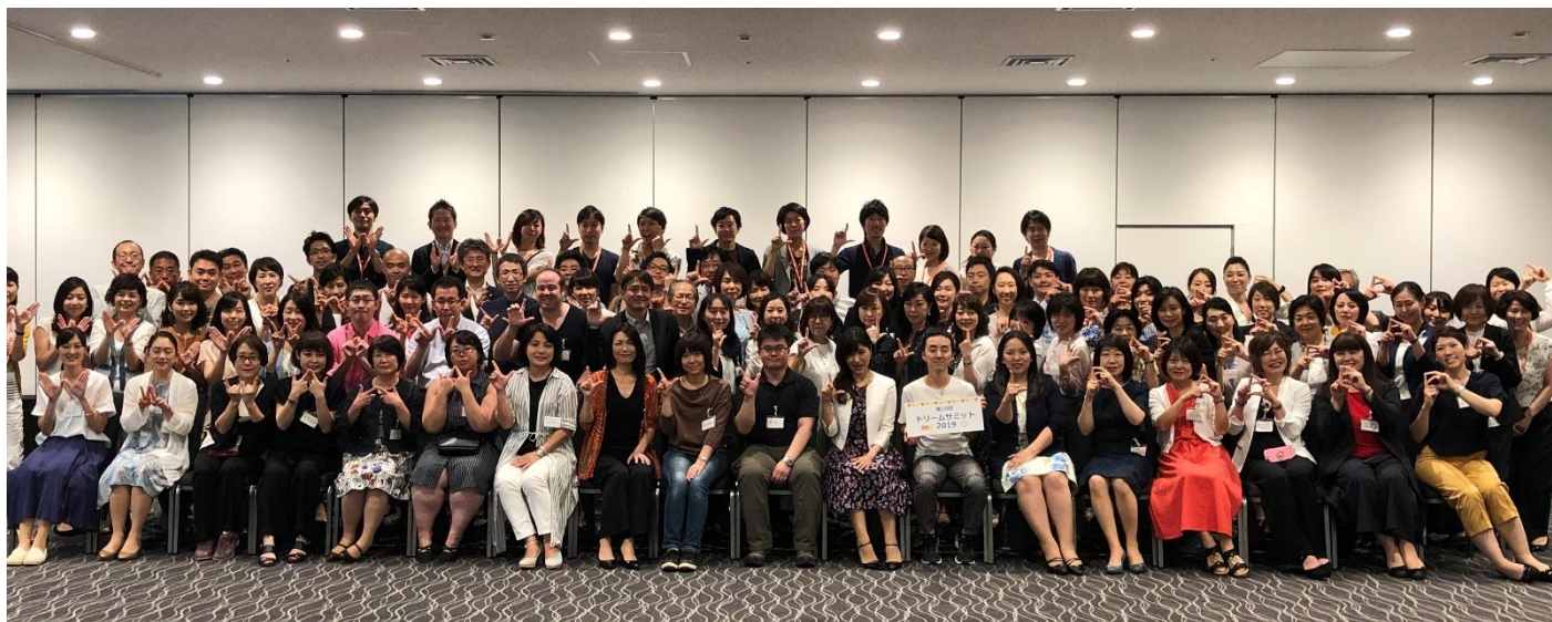
▲全国の認定コンサルタントが集まるドリームサミット（2019年7月）

2006年の創業以来1,000社以上の働き方改革に携わってきた株式会社ワーク・ライフバランス（本社：東京都港区、代表取締役社長：小室淑恵）が2009年より提供する「ワーク・ライフバランスコンサルタント養成講座」が、2021年5月開講の講座で第60期をむかえます。これまでに約1,700名の卒業生を輩出し、全国47都道府県で活躍する彼らの支援を12年にわたり継続しています。2021年7月10日には、ワーク・ライフバランスコンサルタント養成講座を修了し、当社のワーク・ライフバランスコンサルタント制度に加盟した認定コンサルタントを対象にしたドリームサミットを開催、VUCA時代における働き方改革をさらに加速していきます。また、ワーク・ライフバランスコンサルタント養成講座は2025年春までに2,000名の卒業生輩出を目指します。