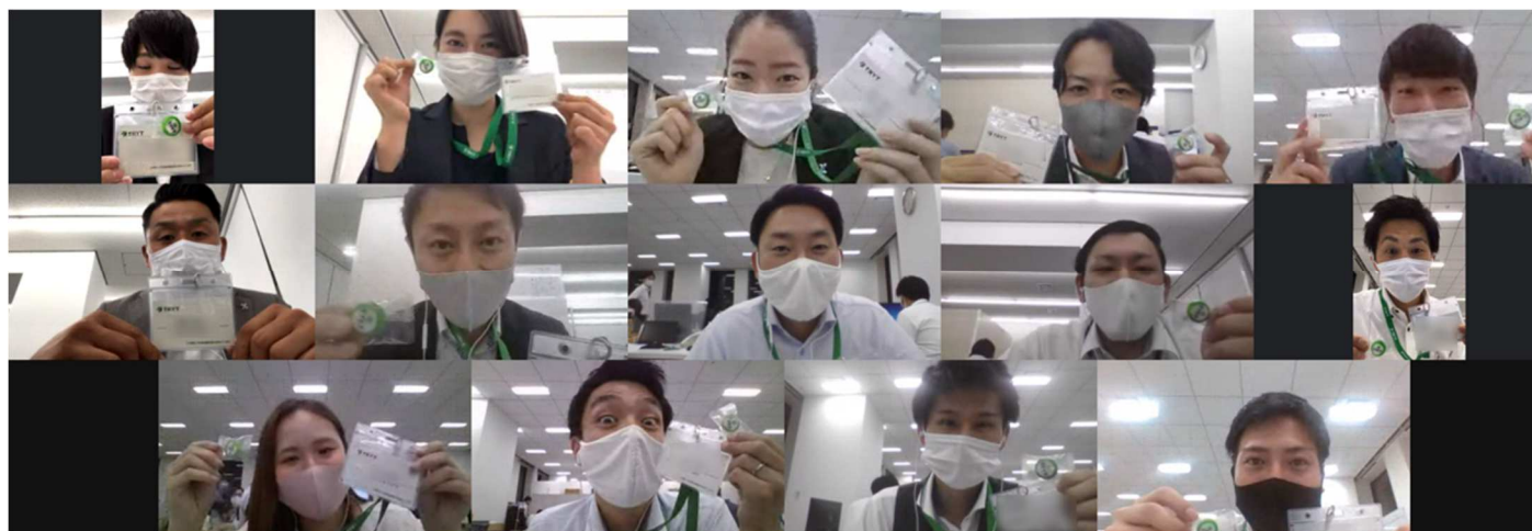
▲社名変更時に撮影した営業所の記念集合写真

その一環として、社内外に対して当社の掲げるミッション・ビジョン・バリュー（以後、MVV）に共感し、行動するきっかけに繋げる企画、「トライトフェスティバル」を実施してきましたが、約半年後の当社の管理職向けアンケートでは、128 名中約 70%が「自分の部署で MVV が浸透していると思う」と回答する結果になりました。