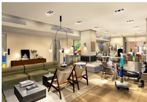
▲ワークラウンジイメージ