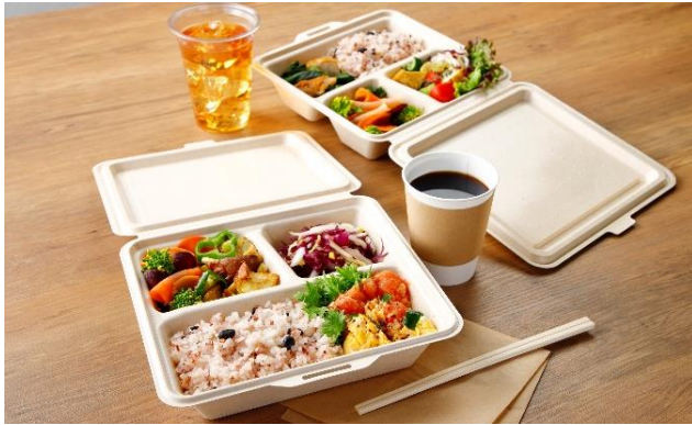
▲取扱商品イメージ