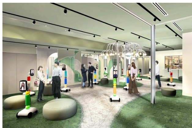
▲アバターパークイメージ