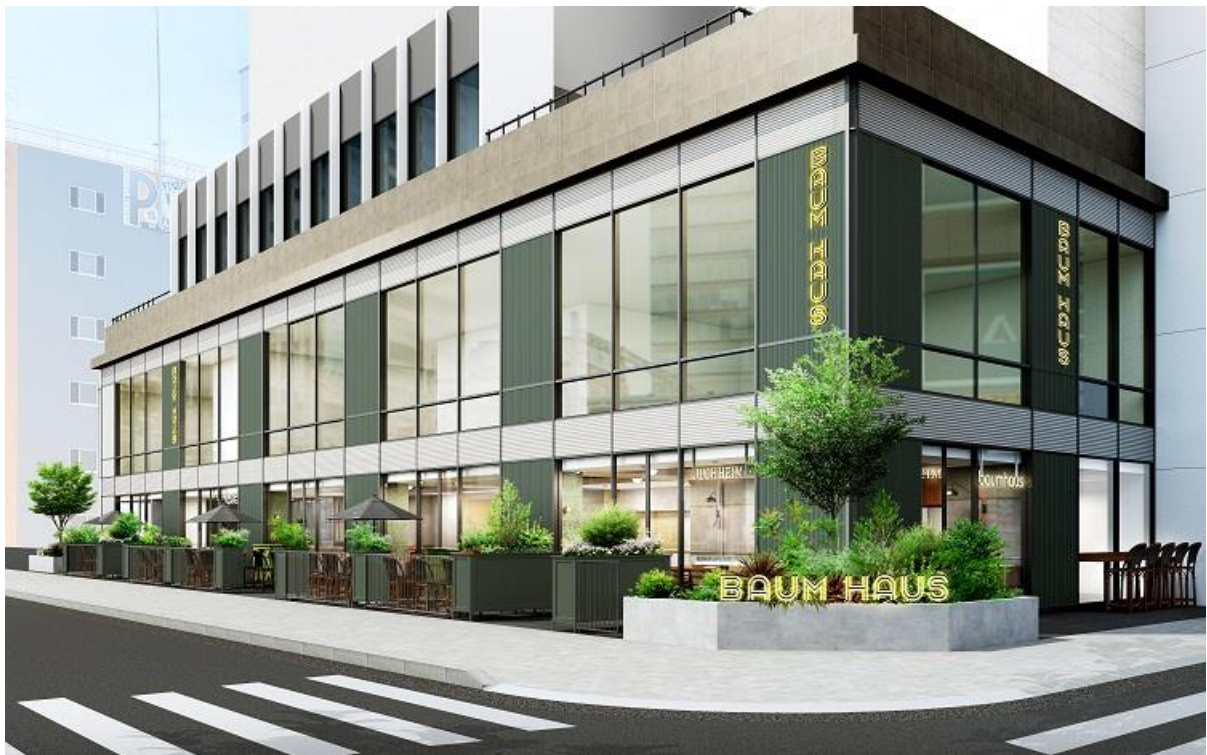
▲BAUM HAUS 外観イメージ

栄駅徒歩7分、矢場公園を臨む立地にオープンする新築複合施設「BAUM HAUS」。1階には、焼きたてのバウムクーヘンや、素材、調理法にこだわったデリ、ベーカリーなどを提供するフードホール「BAUM HAUS EAT (バウムハウス イート)」が、2階には、アバターロボット「newme (ニューミー)」(開発者：avatarin 株式会社)や最新テクノロジーを体験できるショールームなどを併設した次世代ワークスペースとなるシェアオフィス「BAUM HAUS WORK (バウムハウス ワーク)」がそれぞれオープン。