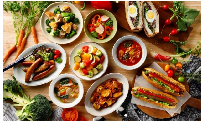
▲取扱商品イメージ