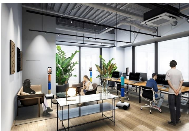
▲オフィスイメージ

そのほか、打合せや商談等で使える個室会議室や、ランチミーティングなどにご利用いただける1階フードホールのボックス席、太陽の光を浴びながら執務ができるテラスのワークスペースなど、充実した共用部を設け、受付コンシェルジュと不定期に開催される様々なイベントが入居者のビジネスをサポートし、新しい働き方の実現を後押しします。