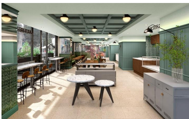
▲BAUM HAUS EAT イメージ

カフェ「THEO'S CAFE」では、ユーハイムが独自開発した人工知能（AI）搭載のバウムクーヘン専用オープン「THEO（テオ）」が無添加焼き立てのバウムクーヘンを提供し、デリ「Deli BAUM HAUS」では素材にこだわり毎日食べても食べ飽きない新鮮な野菜を使った、カラダと環境にやさしいメニューを提供。また、ベーカリー「DONQ ÉDITOR」では限定商品なども用意し、近隣住民やクリエイティブワーカーの心と体を癒すフードホールとなります。