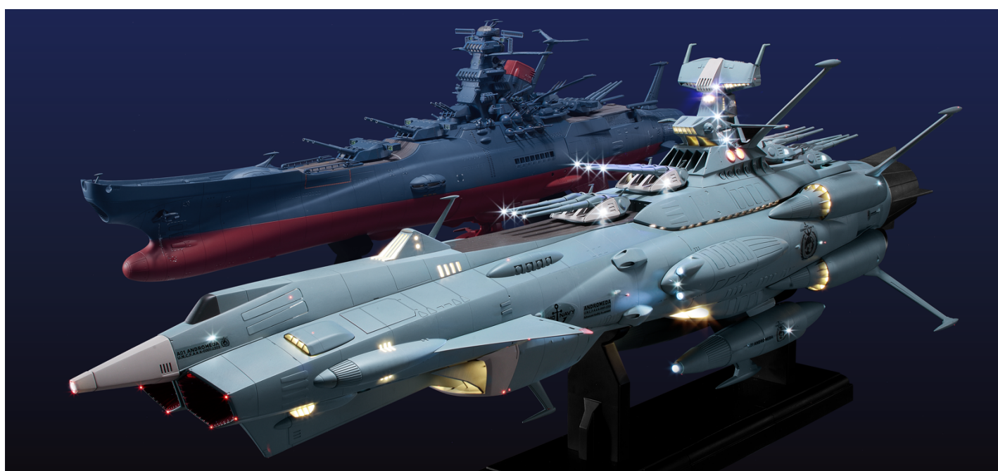
手前：『前衛武装宇宙艦 AAA-1 アンドロメダ 1/350 スケールモデル』完成モデル 奥：『宇宙戦艦ヤマト 2202 ダイキャストギミックモデルをつくる』完成モデル

2021年3月10日（水）より発売 https://www.hcj.jp/andromeda/p