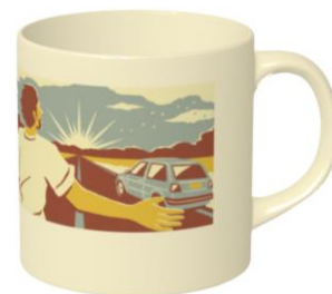
▲オリジナルマグカップイメージ