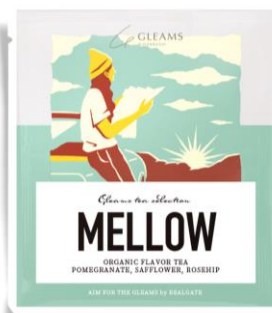
▲グリーンスオリジナルパッケージイメージ