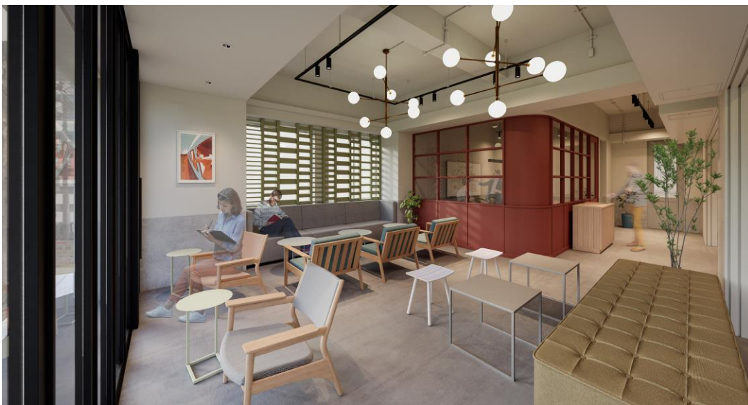
▲GLEAMS AKIHABARA 1F ラウンジイメージ