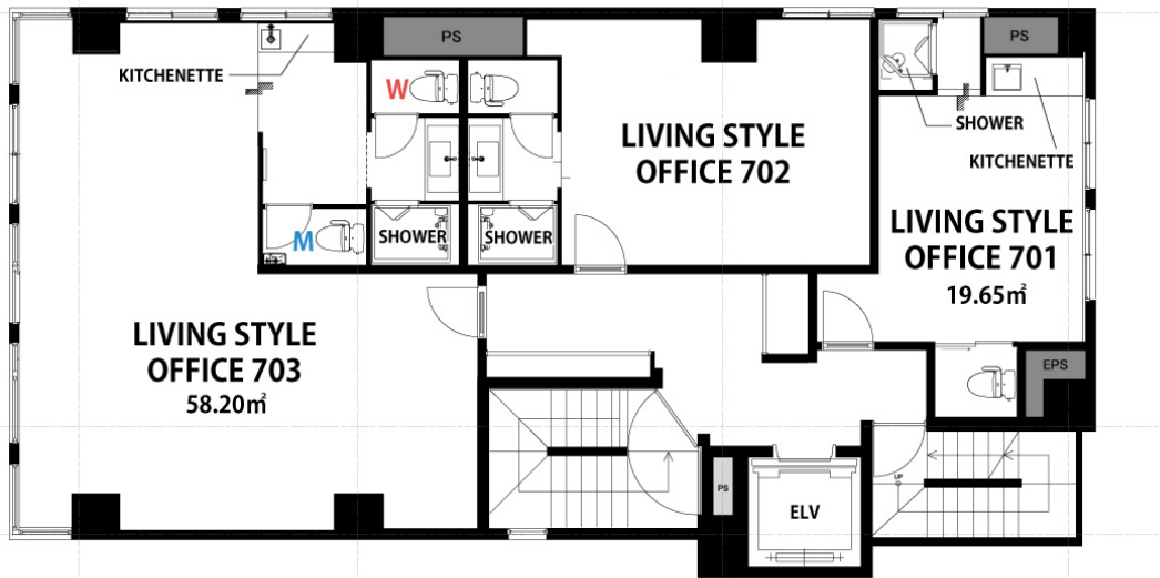
▲GLEAMS AKIHABARA 7階フロア MAP