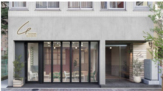
▲GLEAMS AKIHABARA 外観イメージ