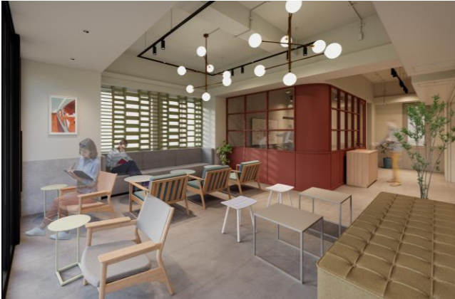
▲GLEAMS AKIHABARA ラウンジイメージ

充実した共用部を備えることで、専有部をワークスペースとして最大限に活用いただけます。