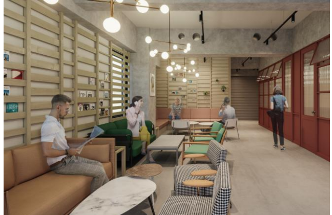
▲GLEAMS NIHONBASHI ラウンジイメージ