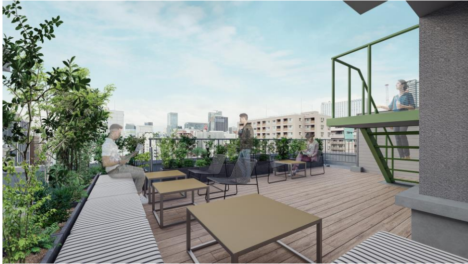
▲屋上 スカイテラスイメージ (GLEAMS AKIHABARA に設置)

GLEAMS AKIHABARA の屋上は、神田川を展望するスカイテラスヘリノバージョン。デッキの上にソファとチェアが並ぶ、グリーンに囲まれたオープンエアな空間です。1階ラウンジとの使い分けにより、社内ミーティングや仕事合間のリフレッシュ、ランチスペースとしてご利用いただけます。リラックスできる空間で、新たなアイデアや社内外のコミュニケーションを自然と引き出す魅力的なスポットです。入居者による貸切利用も可能なため、社内レクリエーションの場としても最適です。