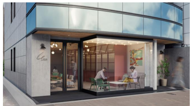
▲GLEAMS NIHONBASHI 外観イメージ