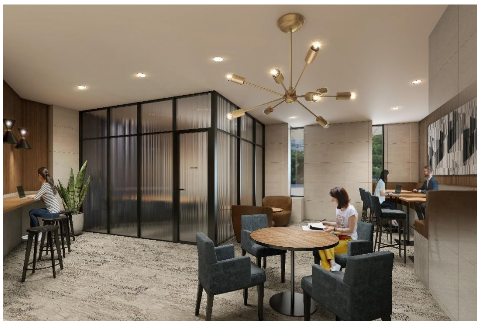
▲ラウンジイメージ

■公式WEBサイト： https://axon-hamamatsucho.jp/