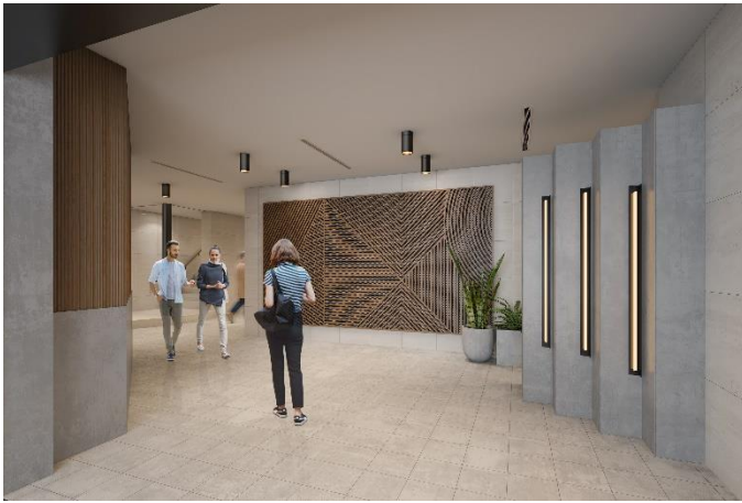
▲エントランスイメージ