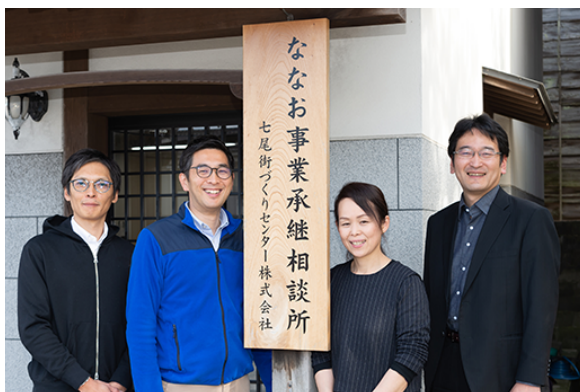
▲七尾の未来を描く七尾街づくりセンター株式会社「ななお事業承継相談所」のメンバー

石川県七尾市、宮崎市において、地方都市の課題である事業承継問題の解決と独立希望者のサポートを目的に、売りたい「地方企業」と移住&独立を目指す「個人」をマッチングする取り組みをスタート。高い関心を集めるも、コロナ下で独立希望者が地方都市へ直接訪問することが難しい点が壁となっており、コロナの影響を受けながら、いかに現地や地元企業と交流し相互に理解促進していくかが今後の課題。