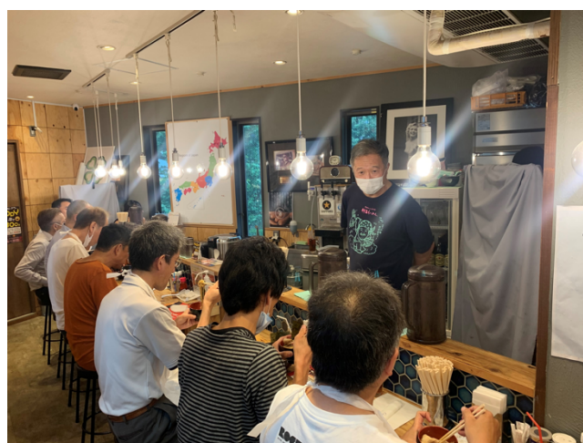
▲ラーメン店にて独立後の説明を受ける参加者の様子