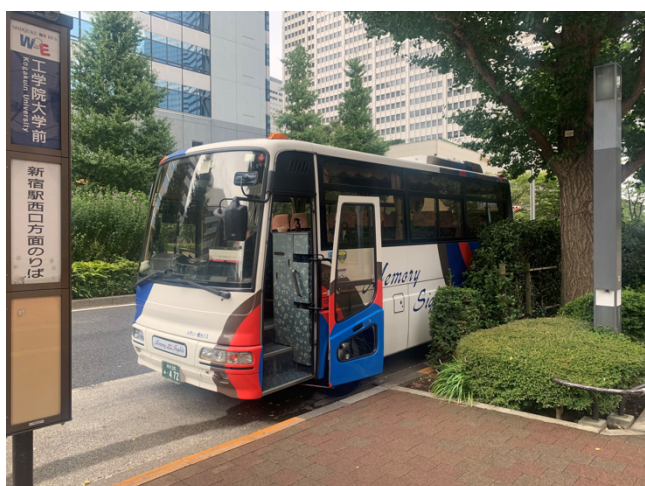
▲バスツアーの様子

異なる業態の3社を回遊する開業先見学のバスツアーや、独立のための各種技術を体感できる技術体験イベントなどを開催。